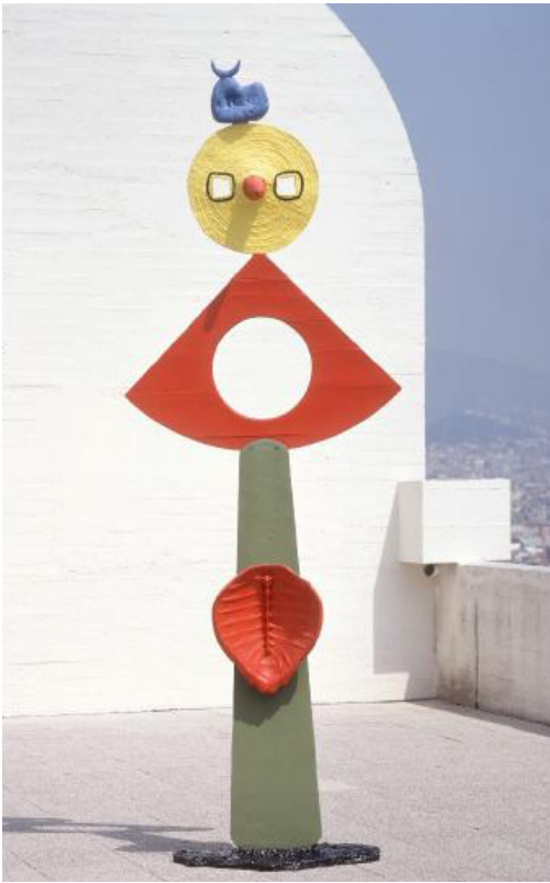
La carícia d'un ocell , de Joan Miró