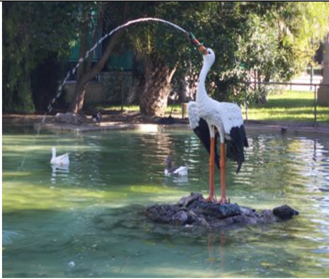
Surtidor en forma de cigüeña