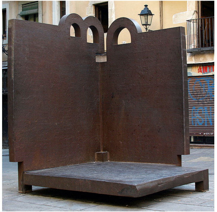
Topos V obra en hierro de Eduardo Chillida .