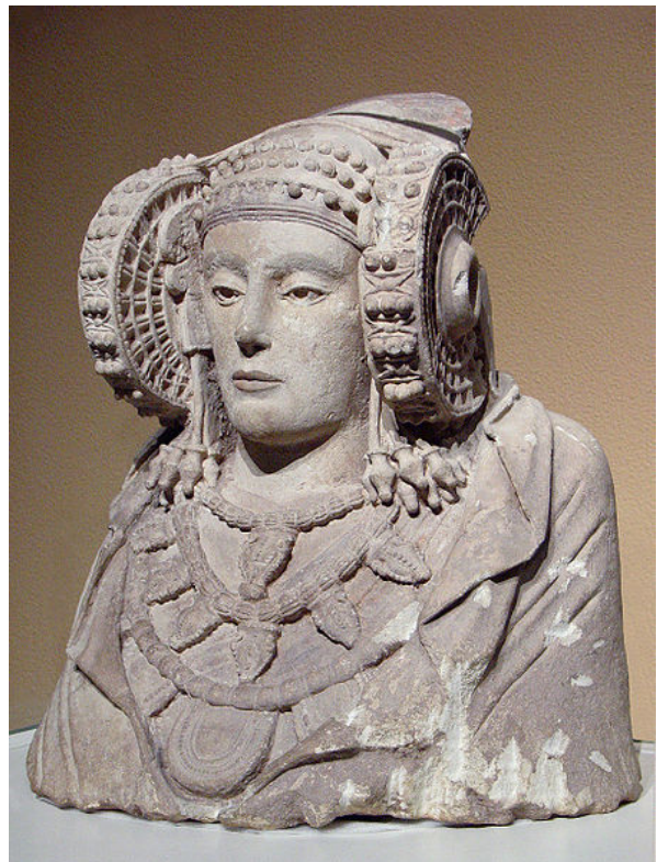
Dama de Elche ( Museo Arqueológico Nacional de España )