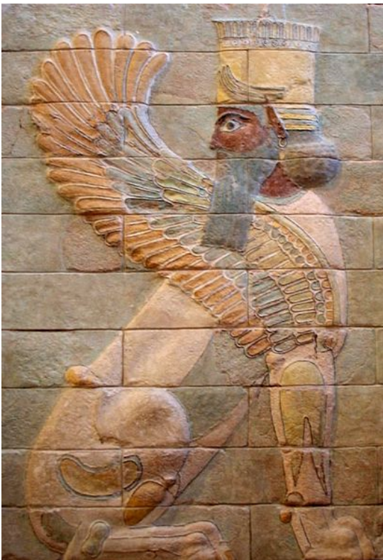
Esfinge de Darío I el Grande , en el Palacio Real de Susa , realizada en ladrillo policromado.