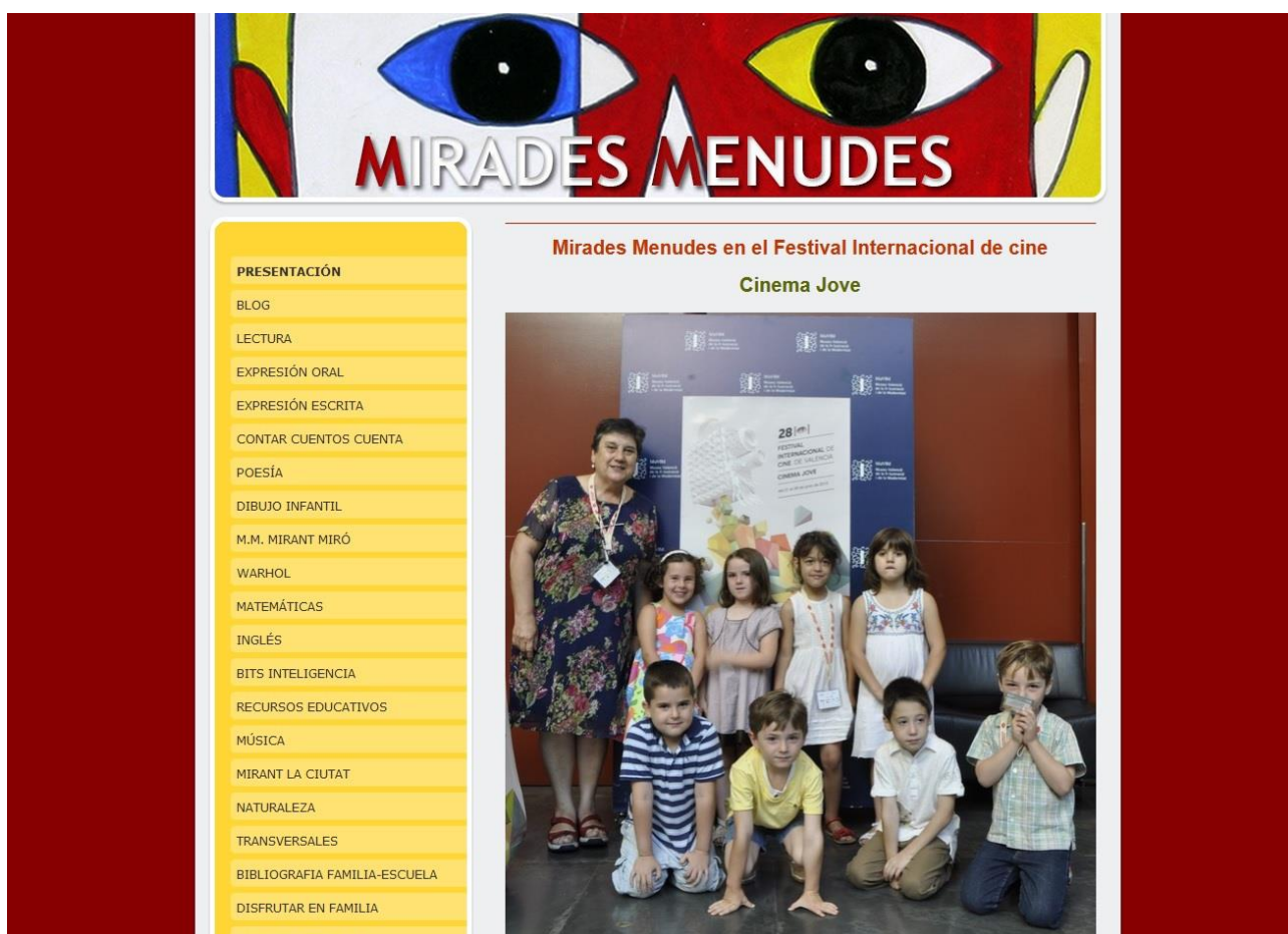
Imagen 1: Página inicial de Mirades Menudes

Como dice Mar de Fontcuberta (1992), ...”no está más informado el individuo que lee cinco periódicos, observa varias cadenas de televisión y oye diferentes emisoras de radio, sino aquel que es capaz de determinar: los elementos básicos para interpretar la información; darse cuenta de las omisiones clave; descubrir las tácticas y estrategias de persuasión empleadas en la emisión de los mensajes, lo cual implica conocer los mecanismos de producción de, la información; y ser capaz, en consecuencia, de aceptar o rechazar el mensaje, global o parcialmente, pero siempre de la manera crítica...”